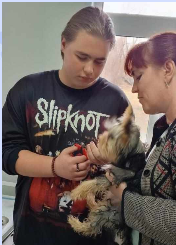
Обрезка когтей щенку