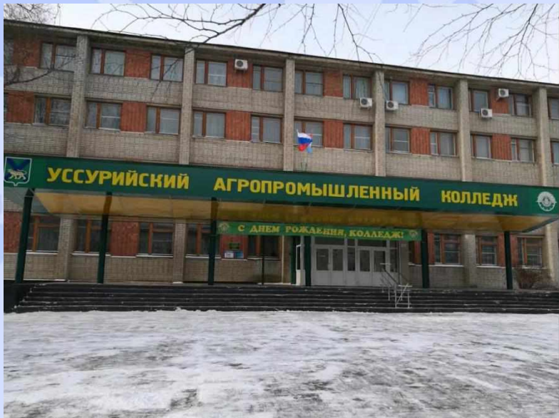
Уссурйский агропромышленный колледж (г. Уссурйск)