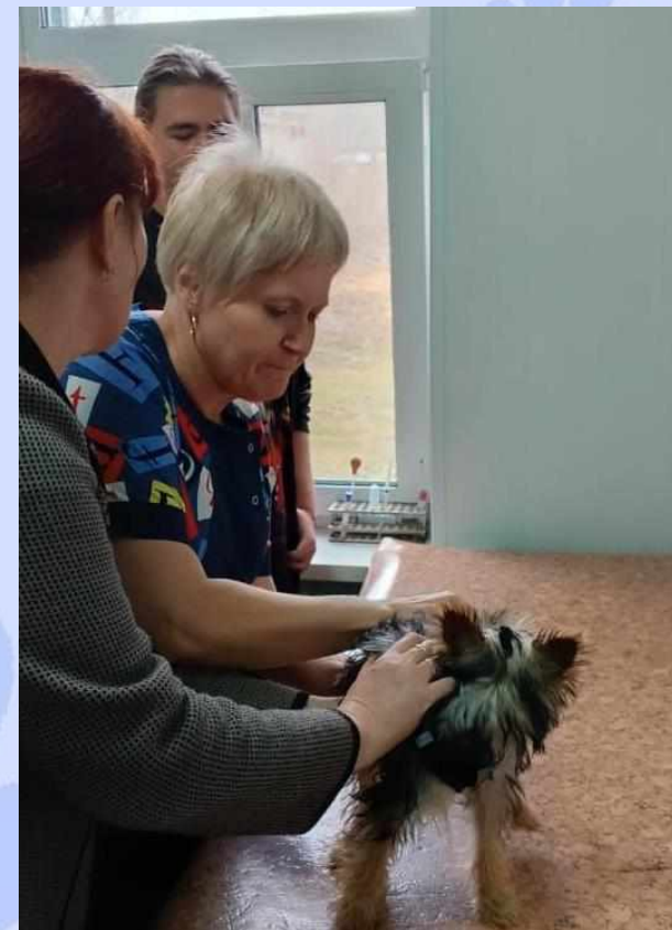
Осмотр перед вакцинацией