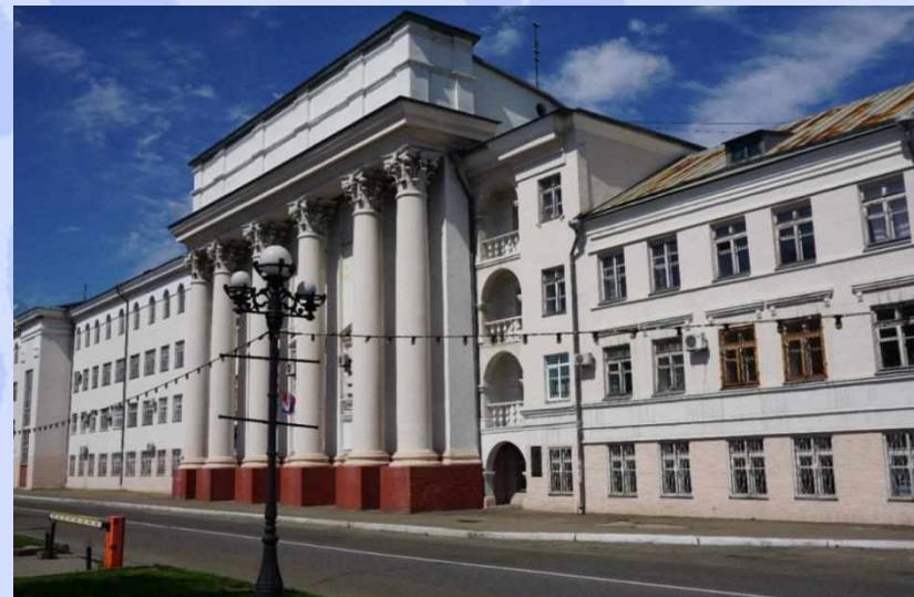
Приморский государственный аграрно-технологический университет (г. Уссурйск)

Специальность «Ветеринария». Срок обучения на базе 11 классов – 5 лет.