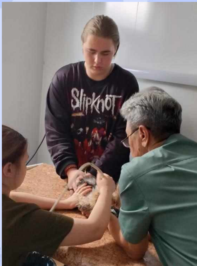
УЗИ живота щенка