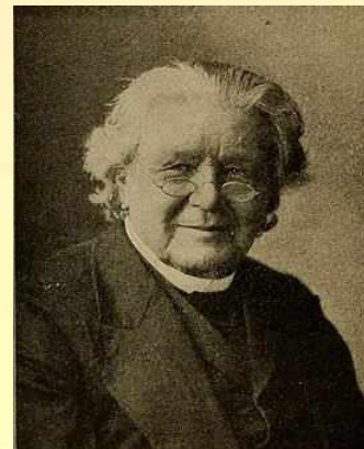
Лоренц Лорен Лангстрот